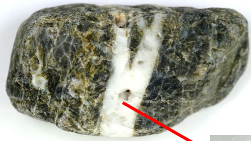
石英の帯が入ったチャート